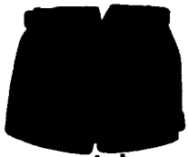
los pantalones cortos